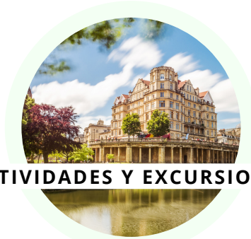
ACTIVIDADES Y EXCURSIONES

El programa de 3 semanas de duración incluye 3 visitas de 1/2 día a lugares de interés en Bath como el museo de Jane Austen y 4 excursiones de día completo.